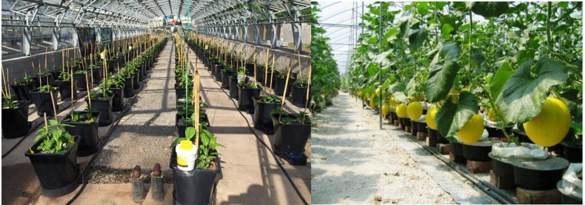
این تصویر نشان می‌دهد که در یک گلخانه، گیاهان در گلدانها کاشی شده و در ردیف‌ها قرار دارند. در تصویر سمت راست، میوه‌های زرد رنگی از یک گیاه در حال رشد در گلدان دیده می‌شود.

در این فصل به بررسی علل و عوامل مختلف منجر به فرسودگی و پوسیدگی گیاهان در گلخانه پرداخته خواهد شد. همچنین روش‌های تشخیص و کنترل این مشکلات نیز مورد بحث قرار خواهد گرفت. در ادامه، به بررسی روش‌های پیشگیری و درمان این مشکلات پرداخته خواهد شد. در نهایت، به بررسی روش‌های استفاده از کودها و سموم در گلخانه پرداخته خواهد شد.